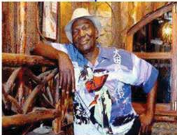
Víctor Hugo Asencio para EL UNIVERSO