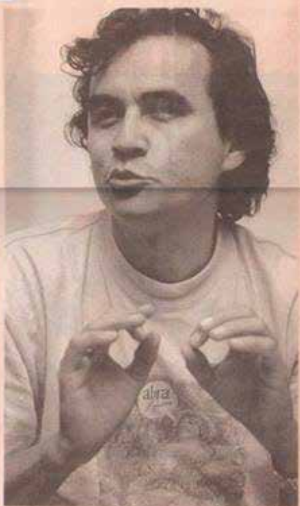
Francisco Centeno / EL UNIVERSO

Las entradas para esta noche cuestan $ 2,50 y $ 5.