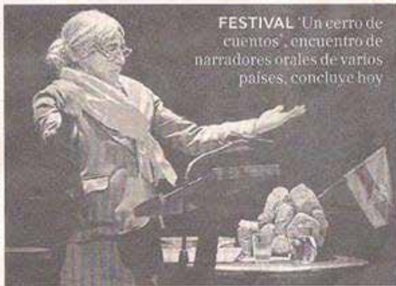
FESTIVAL 'Un cerro de cuentos', encuentro de narradores orales de varios países, concluye hoy