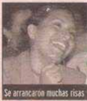
Se arrancaron muchas risas