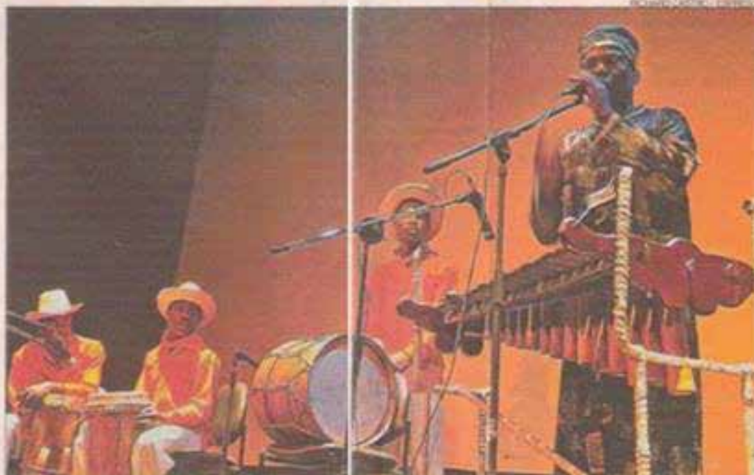
"Papá roncón" y sus músicos interpretaron melodías esmeraldeñas en la sala de cine del MAAC.

Cerca de las 20:00 las voces de los narradores hicieron una pausa. Era tiempo de cambiar de lugar y trasladarse al MAAC, donde por USD 5 accedieron a la fiesta, organizada por "Papá roncón" y su grupo de músicos. La sala se convirtió en una pista de baile, en la que los espectadores y cuenteros se volvieron cómplices de "La caderona" y su "cinturita de chocolate". (FC)